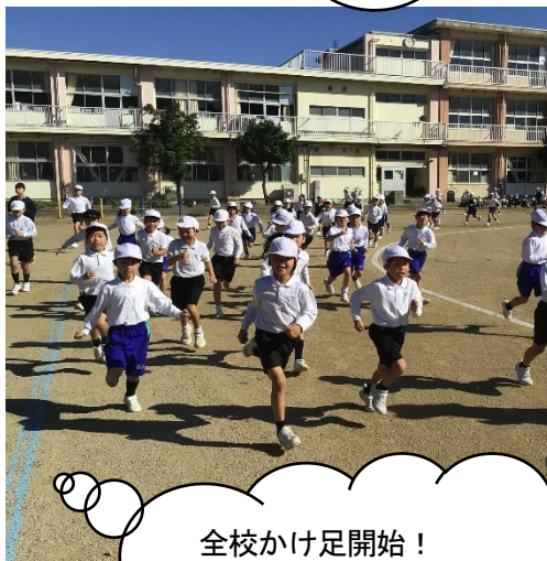
全校かけ足開始！ 12月の持久走大会に向けてみんなで頑張ります。