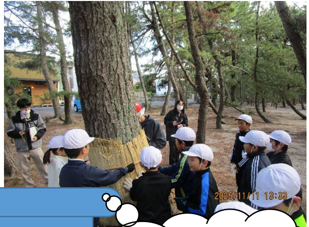
4年生こも巻き。室積海岸の松の木もこれで大丈夫。