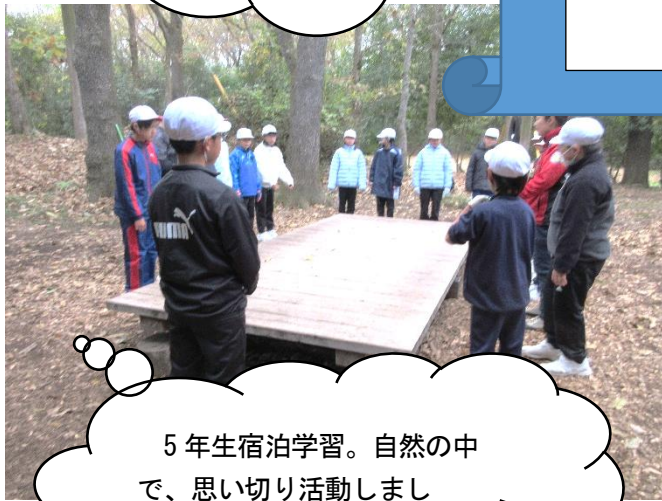
5年生宿泊学習。自然の中で、思い切り活動しました。室小ABCもバッチリ。