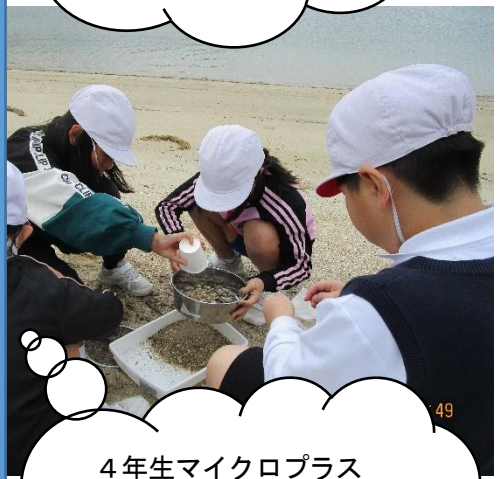
4年生マイクロプラスチック環境学習。室積の海がいつまでもきれいであって欲しいそんな願いを込めて。