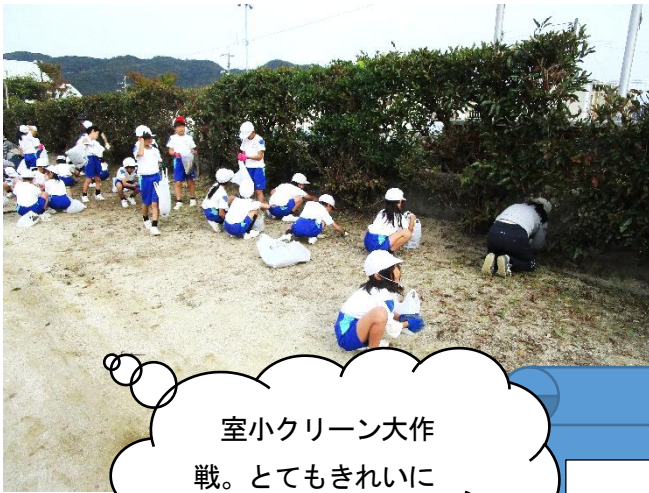
室小クリーン大作戦。とてもきれいになって作戦大成功！