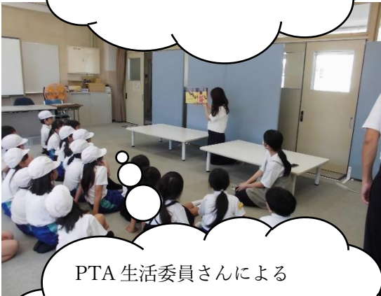
PTA生活委員さんによる読み聞かせ（PTA）子どもたちのほっとできる時間です。