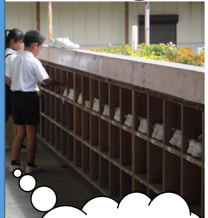
毎日給食の配膳時間を使って靴箱の整理整頓（全校） 室小B