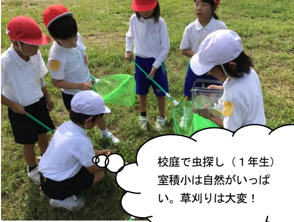
校庭で虫探し（1年生） 室積小は自然がいっぱい。草刈りは大変！