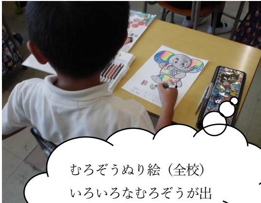
むろぞうぬり絵（全校） いろいろなむろぞうが出来上がりました。